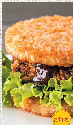
じゃこカツライスバーガー ¥500