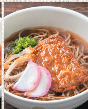
関アジ入りじゃこ天そば ¥550