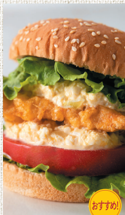
チキン南蛮バーガー ¥500