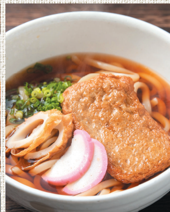
関アジ入りじゃこ天うどん ¥550